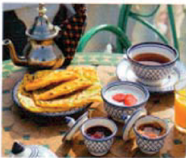
上：毎朝、手作りにされるモロッコ産小麦、焼き立てのムスメン（クレープ）がおいしくて食べ過ぎてしまいたい！ 右：朝食は屋上のテラスで、カモメが目の前までやってくる。